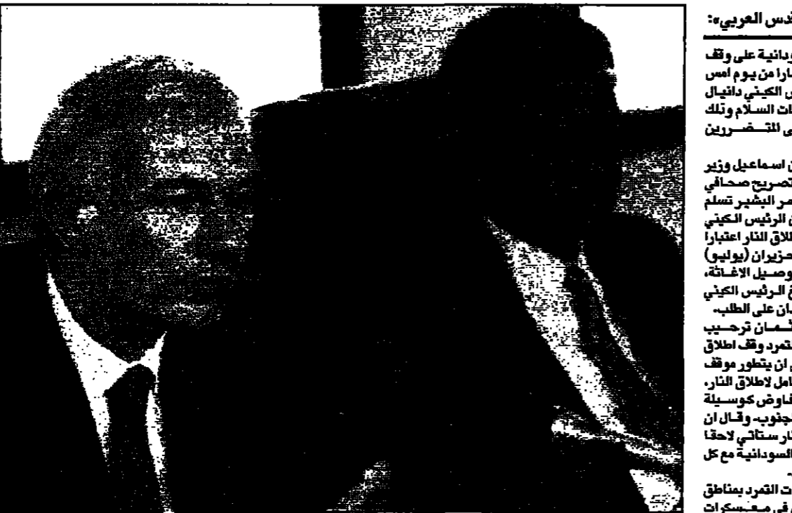
وزير الخارجية السوداني مصطفى اسماعيل مع وزير المولة البريطانية ديرك فانتيت في الخرطوم امس